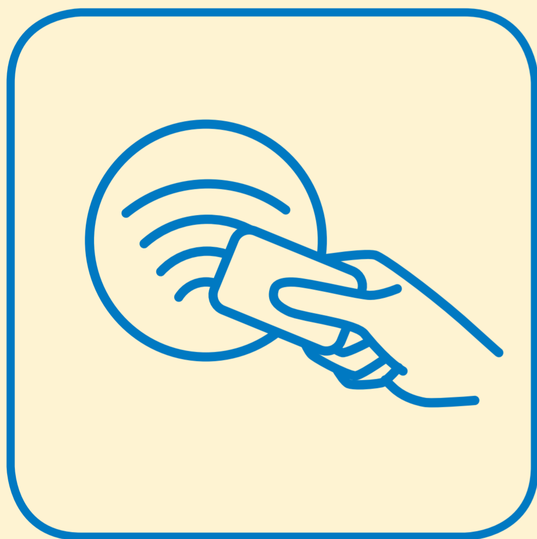
NACH MÖGLICHKEIT KONTAKTLOS ZAHLEN USE CONTACTLESS PAYMENT

DEAR GUEST, please take care of the following health measures.